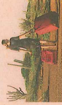
Zware koffer, geen schuld HH

ten de EU verhuist. Van 0,4% ontbreekt elke informatie, 0,3% is overleden.